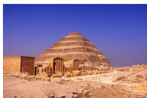
ネチェルケト・ジェセル王の 「階段ピラミッド」