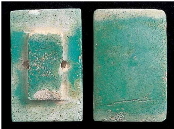
【ほぼ実物大】施釉タイル「エジプト・ファイアンス・タイル」 【出土】サッカーラ/エジプト 【年代】第三王朝期（前 2682-2613 年頃）